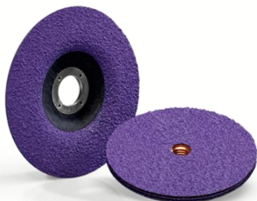
Lukas Purple Grain Single Lukas Purple Grain Multi

The Power of Purple Grain: Aggressief. Volhardend. Ergonomisch.