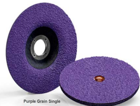
Purple Grain Single